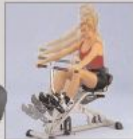
Mouvements de traction