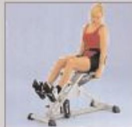
Presse à jambes