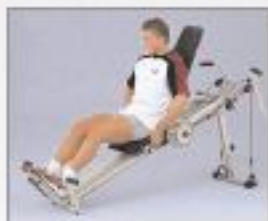
Extension de jambes (haltères courts en vente comme accessoire, voir page 44)